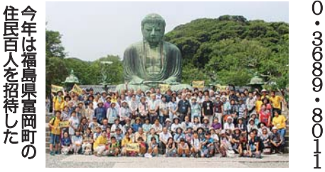
今年には福島県富岡町の住民100人を招待した