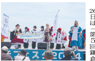
「第23回鎌倉ビーチフェスタ」が5月25・26の両日、鎌倉由比ヶ浜海岸で開かれ大勢の人で賑わった。26日は「第5回鎌倉

市民カーニバル 仮装パレード」も5年ぶりに行われ、公募の市民ら約17組180人が鎌倉市役所前から御成商店街、下馬四ツ角を経てビーチフェスタ会場までパレードした。会期中、13グループがフラダンスを披露、ほかライブやゲームコーナー、ラグビー大会など、訪れた人たちは一足早い夏を楽しんだ。