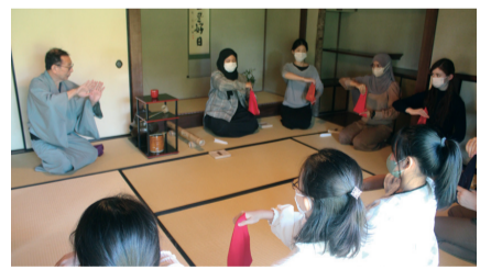
チームを組織して取り組 んでいる慶讃事業の一環 で行われた。

の五輪で選手らは男子 フィン級と同470級で 銅メダルを獲得したもの の、コロナ禍でほとんど 市内での交流の機会を持 たないまま今年3月に市 民サポーターは解散。そ の後にホストタウンとし ての経験を活かそうとホ ランティアの実行委が立 ち上げられ、今回の催し にいたった。