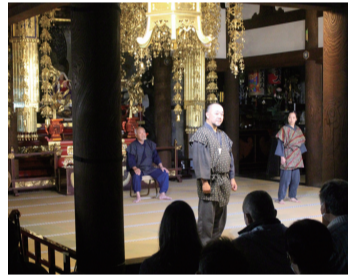
組)が、プロジェクト

日蓮宗本山本覚寺本堂 で10月29日、「不愉快な みほとけく日蓮聖人殺害 計画」と題して地元鎌倉 の紅月劇団による日蓮聖 人劇が午後2時と6時の 2回開催され約160 人が観賞した。写真 今年、宗祖日蓮聖 人御降誕800年にあ たり、日蓮宗市内の18 の日蓮宗寺院からなる 日蓮宗神奈川県第2部 鎌倉組寺院教会(鎌倉 組)が、プロジェクト