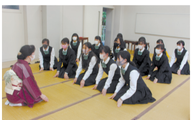
太記念学舎の60畳の和室で稽古を行ってきたが、

年生の新入部員14人の初稽古は、畳に座って挨拶をする立ち振る舞いから。大島さんは、「所作をまねる素直さが大切、おもてなしの心を身につけて輝く女性になってほしい」と心得を語った。