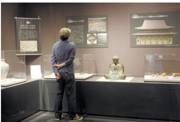
「鎌倉大仏」の名で古くから親しまれている鎌倉市長谷の高徳院本尊・倉市扇方谷で開かれて