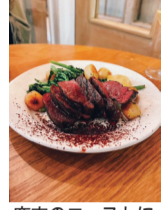
鹿肉のローストにアマゾンカカオ