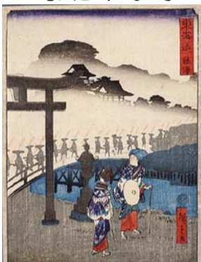
二代歌川広重「東海道 藤沢」

「浮世絵は江戸時代の文化の縮図です。浮世絵を通して郷土に親しみを、浮世絵を通して郷土に親しみを、浮世絵を通して郷土に親しみを。」