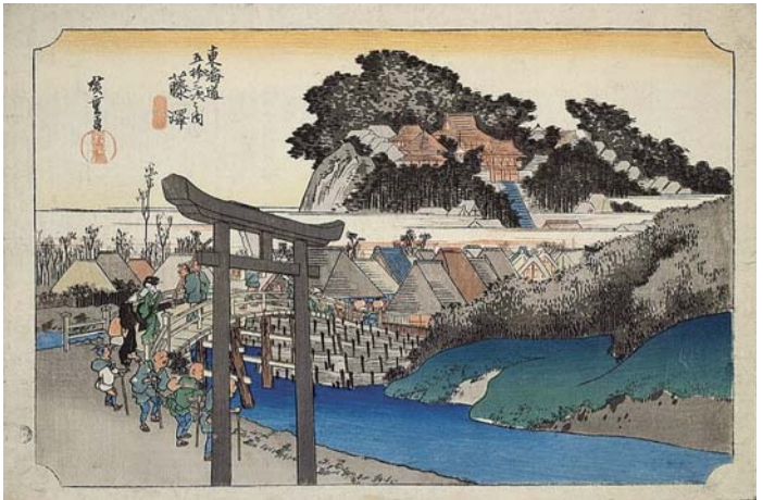
歌川広重「東海道五拾三次之内 藤沢」

「浮世絵は江戸時代の文化の縮図です。浮世絵を通して郷土に親しみを、浮世絵を通して郷土に親しみを、浮世絵を通して郷土に親しみを。」