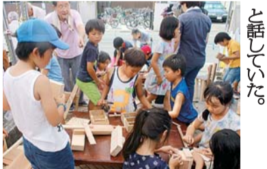
小学生が地元で夏休み勉強会

「夏休み小学生勉強会」が鎌倉市材木座の材木座公会堂で7月23・25日の3日間午前9時〜夕方まで行われ、地域の子どもたち延べ約300人が参加した。写真。