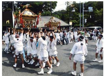
編岡八幡宮で8月6日から9日の4日間ぼんぼり祭が開かれた二写真は松原省吾撮影。

鎌倉・山内八雲神社例大祭の神幸祭が7月22日行われ、炎暑の中、大勢の見物客が見守った行合祭も呼ばれ、山内八雲神社の神輿は、建長寺などの寺を巡った後、北鎌倉駅前で山崎八雲神社の女神輿と合流。2基の神輿は、光昭寺付近の天王屋敷まで渡御すると、そこで出合い神事が行われ、身ももった山崎の神輿にさらしの腹帯が巻かれて戻っていく。