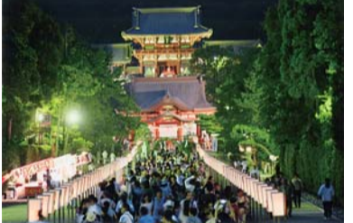
小学生が地元で夏休み勉強会

ら9回の稽古があり、着物や歩き方などの所作を身につけた子どもたちは、発表会で保護者たちの前に開かれ、7月20日発表会が開かれた。写真。