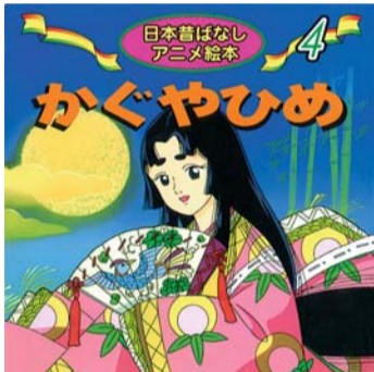
かぐやひめ「竹取物語」 「日本昔ばなしアニメ絵本」より

これら歌の背景をな しているのは『古事記』 『日本書紀』『風土記』 に多くの例が挙げられて いる春山入りである。こ の、古代から行われてい た初春の予 祝行事は、 草木が芽生 え自然の生 命力が盛ん になる春 に、若いも 若きも山に 登って、旺 盛な自然の生命力に感染 して人々の生命力を増加 させるという鎮魂(タマ フリ)の行事であった。 春になると山々にいっせ