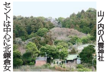
山ノ内の八雲神社