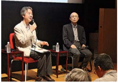
大嶋拓監督(左)と大嶋監督(右)のトークショーの様子

戦後の日本で開校し、4年半で幕を閉じた鎌倉アカデミアを描いたドキュメンタリー映画『鎌倉アカデミア 青の時代』の全国上映に先駆けて、5月14日鎌倉市雪ノ下の鎌倉市川喜多映画記念館で上映会と映画監督のトークが行われた。写真。大嶋拓監督は、鎌倉アカデミア演劇科の教授を