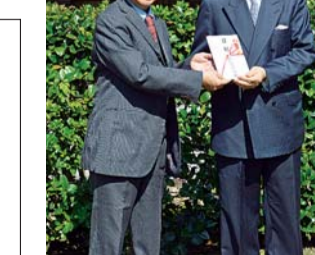
「鎌倉俳句」に寄付を行った。