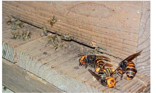
大きさ比較 ニホンミツバチとオオスズメバチ

濃いと思えな い。 鎌倉で よく見か けるスズ メバチに はオオ スズメバ チ、キ ロスズメ バチ、コ ガタスズメバチがある。 オオスズメバチは地中 に巣を作る。切り通しや 谷戸が多く崖の上で根の 浮いた古木の下の格好の 営巣地となる。