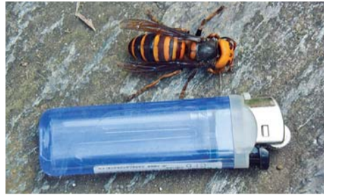
体長4cmのオオスズメバチ

今年はスズメバチの被害が新聞・テレビでニュースとして数多く取り上げられている。この3年はスズメバチがめっきり数を減らして街中で巣を見かけることが少なかった。当欄8月号でニホンミツバチの復活を報告したが予想どおりにスズメバチも復活を果たした。ニホンミツバチは狩りバチであるスズメバチの貴重な食料で両者の群れの盛衰は正比例する。ミツバチを初めて飼った。オオスズメバチの復活を報告したが予想どおりにスズメバチも復活を果たした。ニホンミツバチは狩りバチであるスズメバチの貴重な食料で両者の群れの盛衰は正比例する。ミツバチを初めて飼った。