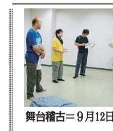
舞台稽古=9月12日写す

▼ふじさわ江の島花火大会 10月15日(荒天16日) 18時〜18時45分、片瀬海岸西浜。3千発。藤沢市観光協会 ☎0466・224141